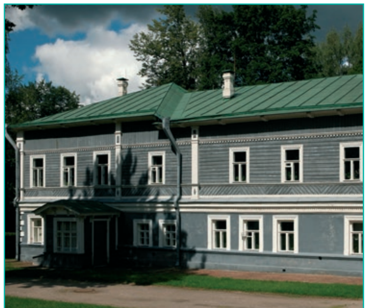
KLIN DONDE SE UBICA LA CASA DEL GENIAL COMPOSITOR TCHAIKOVSKY.